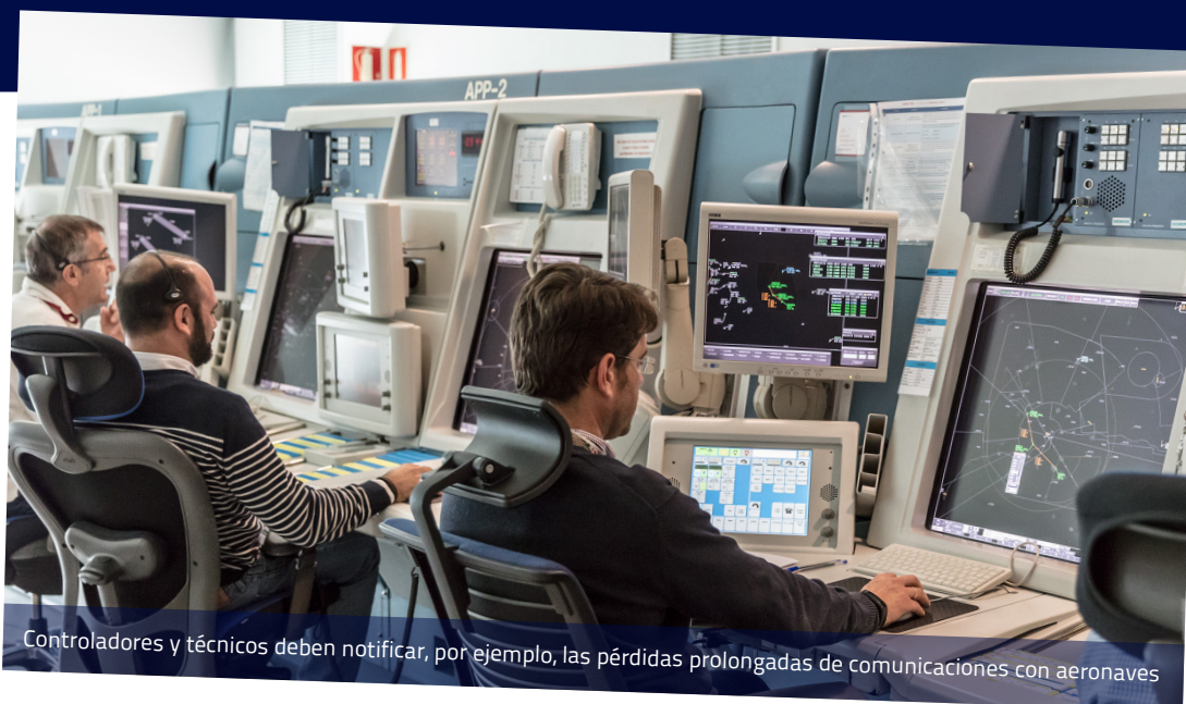
Controladores y técnicos deben notificar, por ejemplo, las pérdidas prolongadas de comunicaciones con aeronaves

Cualquier suceso que pueda afectar a la seguridad aérea debe ser notificado completa y libremente, garantizando una investigación objetiva y confidencial