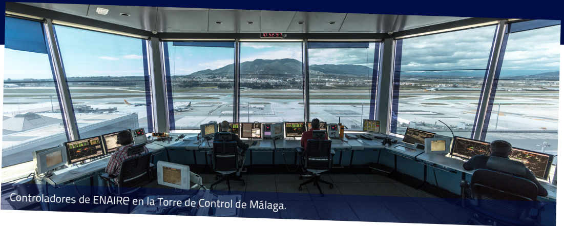
Controladores de ENAIRe en la Torre de Control de Málaga.

Jefatura de la torre de control del Aeropuerto de Málaga-Costa del Sol.